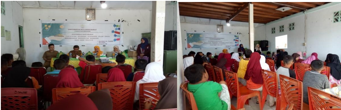
Gambar 3 Suasana pelatihan pencatatan keuangan sederhana dalam upaya menumbuhkan kepedulian menabung anak-anak Desa Bonde

peserta memahami pentingnya menabung. Pelatihan pencatatan keuangan sederhana dalam upaya menumbuhkan kepedulian menabung berlangsung sesuai dengan rencana tanpa ada kendala yang begitu signifikan (Gambar 3).