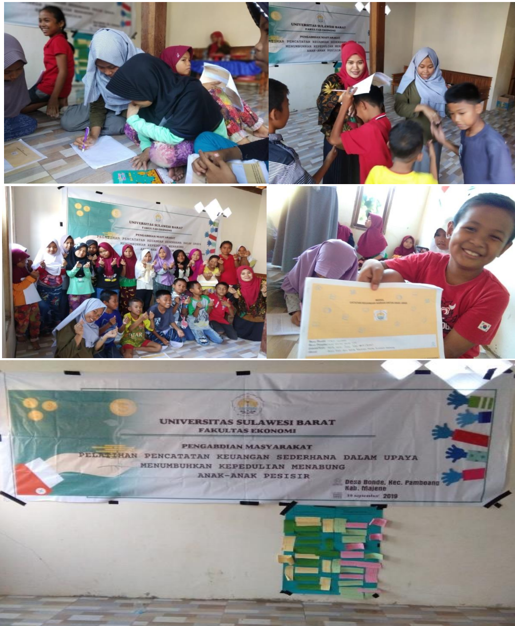
Gambar 4 Suasana pendampingan pencatatan keuangan sederhana dalam upaya menumbuhkan kepedulian menabung anak-anak Desa Bonde

Modul catatan keuangan sederhana untuk anak-anak menjadi salah satu motivasi anak-anak untuk menabung. Selain itu, modul ini bertujuan untuk melatih kejujuran anak-anak dengan mencatat pemasukan dan pengeluaran mereka dengan sebenarnya berdasarkan bukti. Andarsari dan Dura (2018) dalam tulisannya mengemukakan bahwa pencatatan penerimaan dan pengeluaran harus sesuai dengan bukti transaksi yang terjadi dan telah dikumpulkan. Dengan adanya gerakan menabung dan catatan keuangan sederhana yang dilakukan oleh anak-anak Desa Bonde, orang tua terutama untuk ibu rumah tangga diharapkan juga dapat termotivasi dalam melakukan hal yang sama. Siska dan Sutrisno (2015) dalam penelitiannya mengemukakan bahwa motivasi menabung yang jarang dilakukan oleh ibu rumah tangga adalah motivasi catatan pengeluaran dan motivasi penilaian ulang tujuan penyimpanan dana. Sedangkan motivasi menabung yang tidak pernah dilakukan ibu rumah tangga adalah motivasi pemotongan pengeluaran, mempertimbangan prioritas dan menghentikan penggunaan kartu kredit.