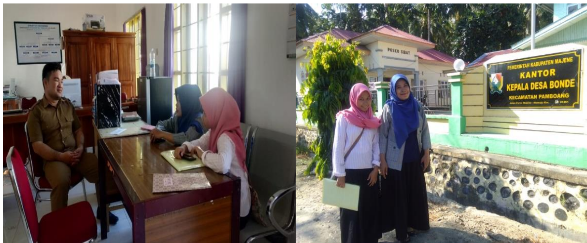
Gambar 2 Koordinasi dengan aparat Desa Bonde

Dukungan terhadap kegiatan ini juga ditunjukkan oleh pemerintah desa setempat. Hal ini ditunjukkan sejak awal berkoordinasi (Gambar 2). Kepala Desa, Sekertaris Desa dan beberapa staf desa juga hadir mengikuti kegiatan pelatihan. Kegiatan pelatihan diawali dengan acara pembukaan yang berlangsung selama 30 menit. Dalam sambutannya, Kepala Desa menyatakan dukungannya dan mengapresiasi kegiatan pelatihan ini dalam rangka menurunkan budaya konsumtif anak-anak di Desa Bonde. Koordinator Prodi Akuntansi Fakultas Ekonomi Universitas Sulawesi Barat mengharapkan anak-anak di Desa Bonde memiliki motivasi dan kepedulian menabung sejak dini untuk masa depan.