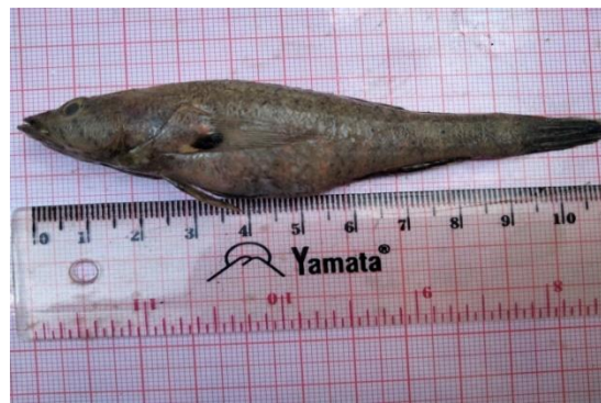
Gambar 1. Ikan Butuh Keleng ( Butis butis )

Butis butis selain dikonsumsi, ikan ini sangat berpotensi untuk dijadikan ikan hias. Orang berkeinginan mau menjadikannya sebagai ikan peliharaan salah satunya karena perilaku dari ikan yang terlihat lucu dan unik. Di beberapa wilayah ikan Butis butis telah dimanfaatkan sebagai ikan hias, mengingat tingkah lakunya yang cukup unik maka harganya pun terbilang cukup mahal yakni bisa mencapai Rp. 70.000/ekor (Manullang & Khairul, 2020).