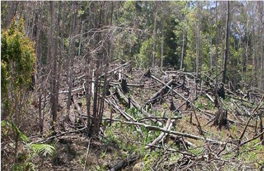
Gambar 1. Tekanan Manusia yang Menyebabkan Kerusakan Hutan