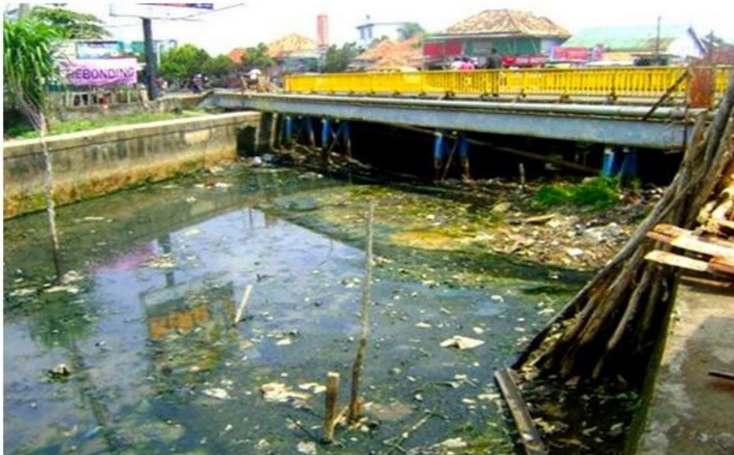
Gambar 2. Sungai Menjadi Tempat Berlabuh Sampah