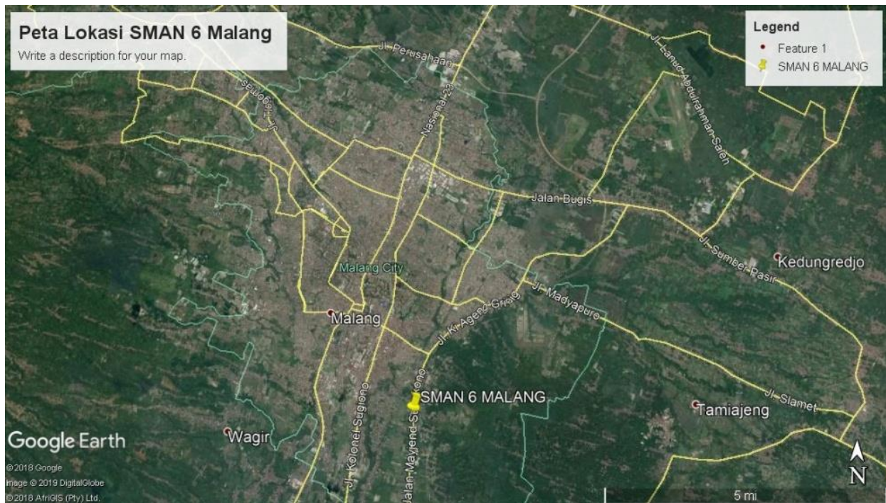
Gambar 1: Peta Lokasi Penelitian (Google Earth Pro, Diakses tanggal 22/5/2019)