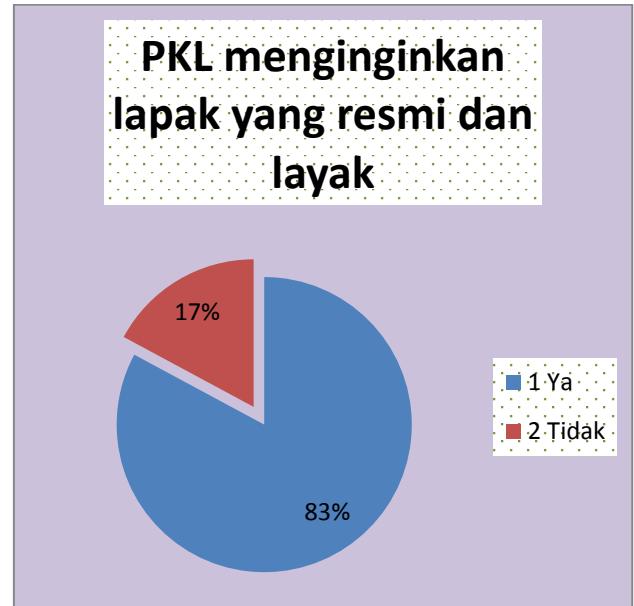
Gambar Diagram PKL menginginkan lapak yang resmi